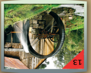
Moinho São José:

Um passeio especial em meio a muito verde e ar puro, perfeito para exercícios e caminhadas. Com 1,8km de extensão, é um espaço para momentos de tranquilidade e saúde. Construída sobre a antiga malha ferroviária em 1996, e entregue à população em 1997, a Ciclovia é um espaço feito para você exercitar o corpo e a mente. Faça um passeio e renove suas energias.