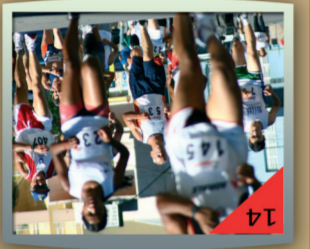
Rústica de São Silvestre:

Abriando grandes festas e comemorações, o Centro Municipal de Eventos é também a casa da Associação Carlos Barbosa de Futsal - ACBF, que representa a força do futsal barboense em todo o Brasil e no exterior. O time transformou a cidade em uma referência para o esporte e faz vibrar o coração com o orgulho de ser barboense. www.acbf.com.br