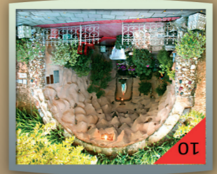
Gruta Nossa Senhora de Lourdes:

Dedicada à Nossa Senhora Mãe de Deus, foi construída em 1943 com o apoio de toda a comunidade. A igreja possui uma torre com quatro sinos, confeccionados com metais também doados pela população. Em momentos especiais ainda é possível ouvir as badaladas dos sinos que ecoam pela cidade. Visite a Igreja Matriz e descubra o que a força e a fé de um povo podem construir.