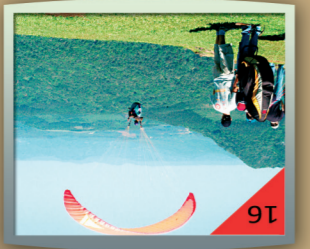
Morro do Diabo:

As atrações religiosas fazem da cidade um roteiro inesquecível. A Paixão de Cristo é uma encenação que inicia na Igreja Matriz e atrai cerca de 10 mil pessoas em peregrinação até o Morro Calvário. O espetáculo encerra com a Crucificação e Ressurreição de Jesus Cristo, momentos mais esperados pelo público. Acompanhe e emocione-se com essa história marcada pela fé e religiosidade.