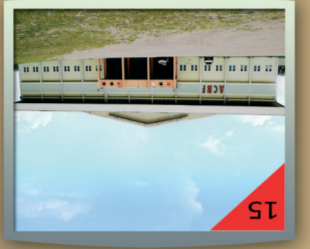
Centro Municipal de Eventos - ACBF:

Considerada como uma das melhores rampas para a prática do voo livre do estado, este atrativo possui 655m de altura e excelente acesso para receber atletas e visitantes. O local abriga diversas competições do gênero durante o ano. Aventura-se neste lugar repleto de beleza e adrenalina.