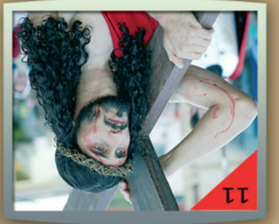
Encenação da Paixão e Morte de Cristo:

Abriando anualmente as cenas finais da Matriz e atrai cerca de 10 mil pessoas em peregrinação até o Morro Calvário. O espetáculo encerra com a Crucificação e Ressurreição de Jesus Cristo, momentos mais esperados pelo público. Acompanhe e emocione-se com essa história marcada pela fé e religiosidade.