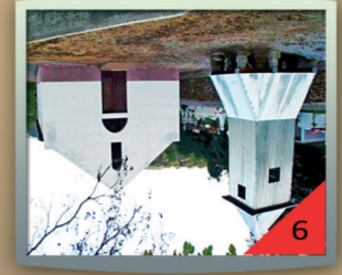
Capela Santo Antônio Abade:

Construída em 1929, através da união de esforços de diversas famílias da comunidade, a Gruta é mais um exemplo da religiosidade e associativismo dos imigrantes e seus descendentes. Antigo ponto de parada para matar a sede e dar de beber aos animais, até hoje as pessoas buscam água no local, com a crença que faz bem ao corpo e à alma.