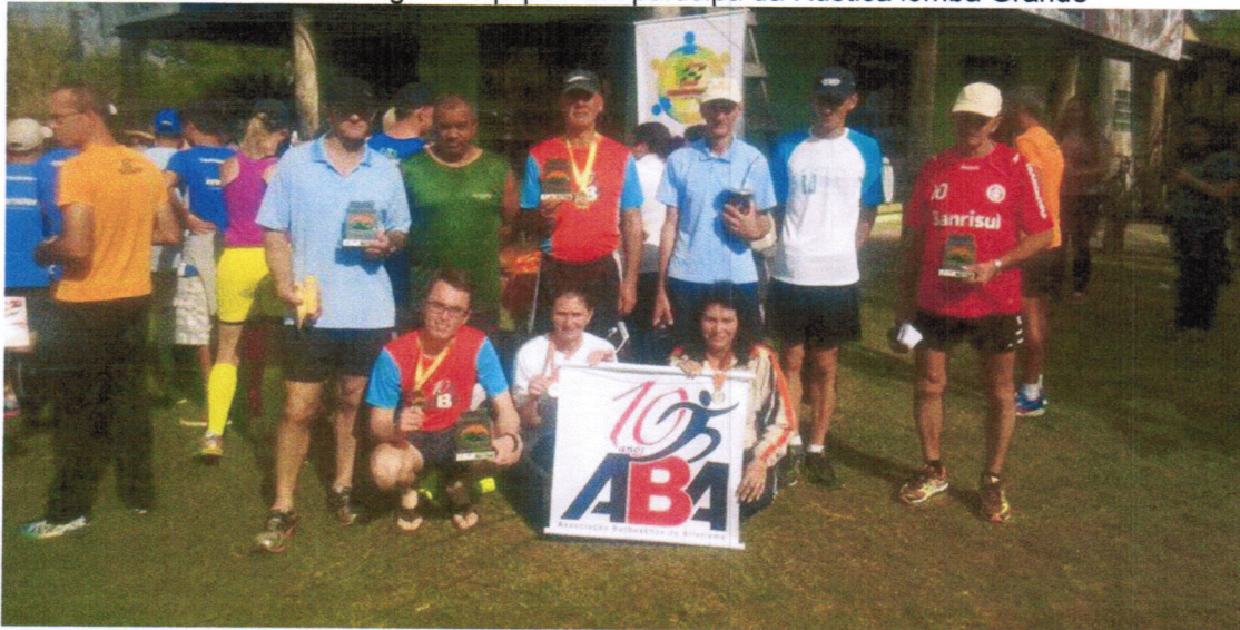
05 de Julho de 2015.....Aba partticipa da Rústica de Inverno de Campo Bom

A equipe Aba participou de 2 provas no total no decorrer dos meses: 17 de Maio em Novo Hamburgo. A equipe ABA participa da Rústica lomba Grande