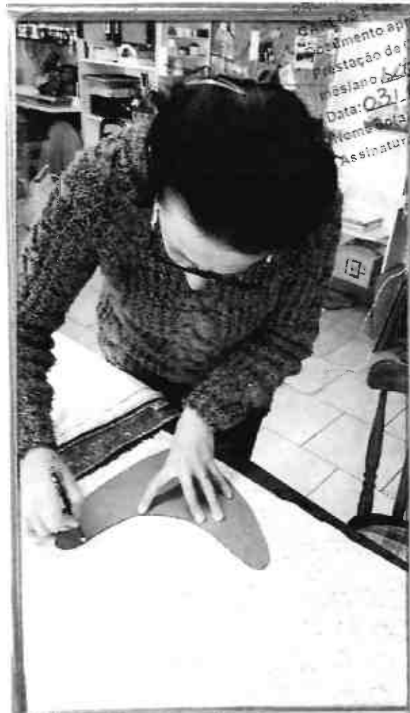
Artista: Vera Stefani