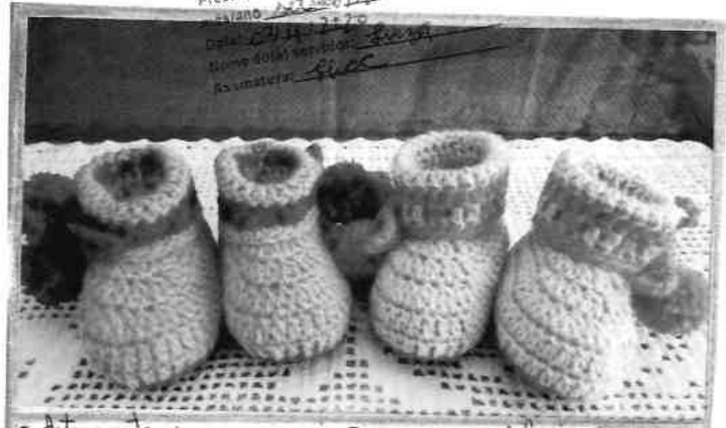
Atividades para exposição e comercialização na sede da entidade.