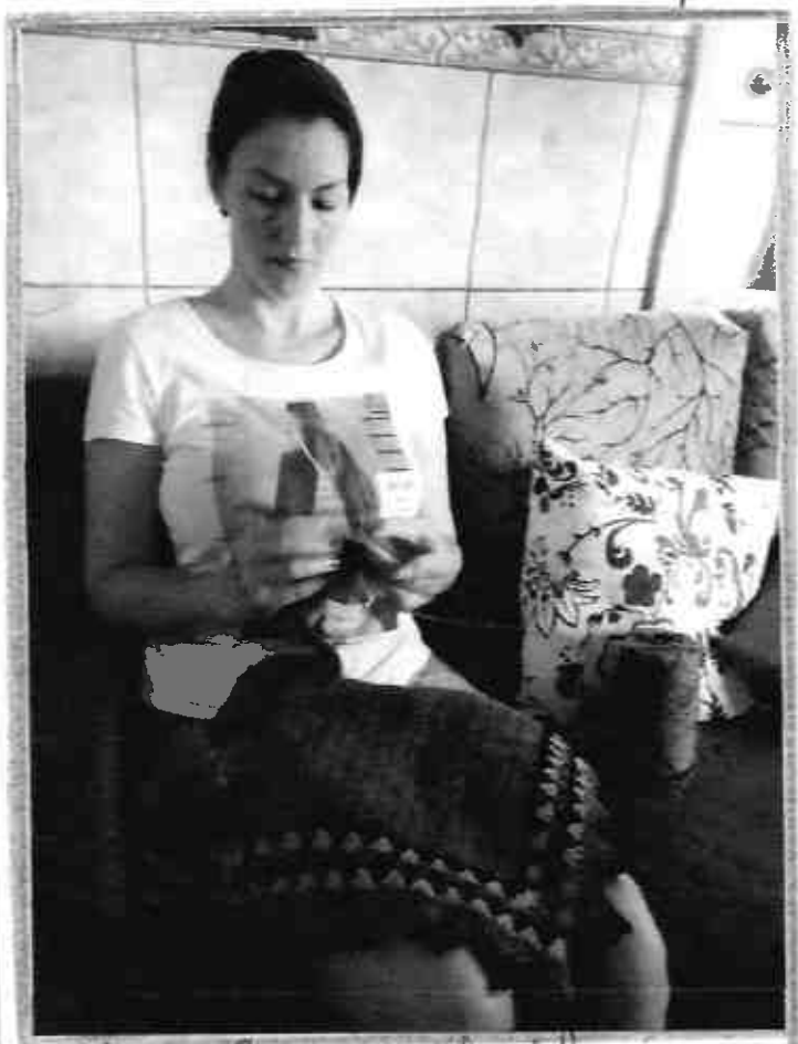
Ativista: da D. Liippo