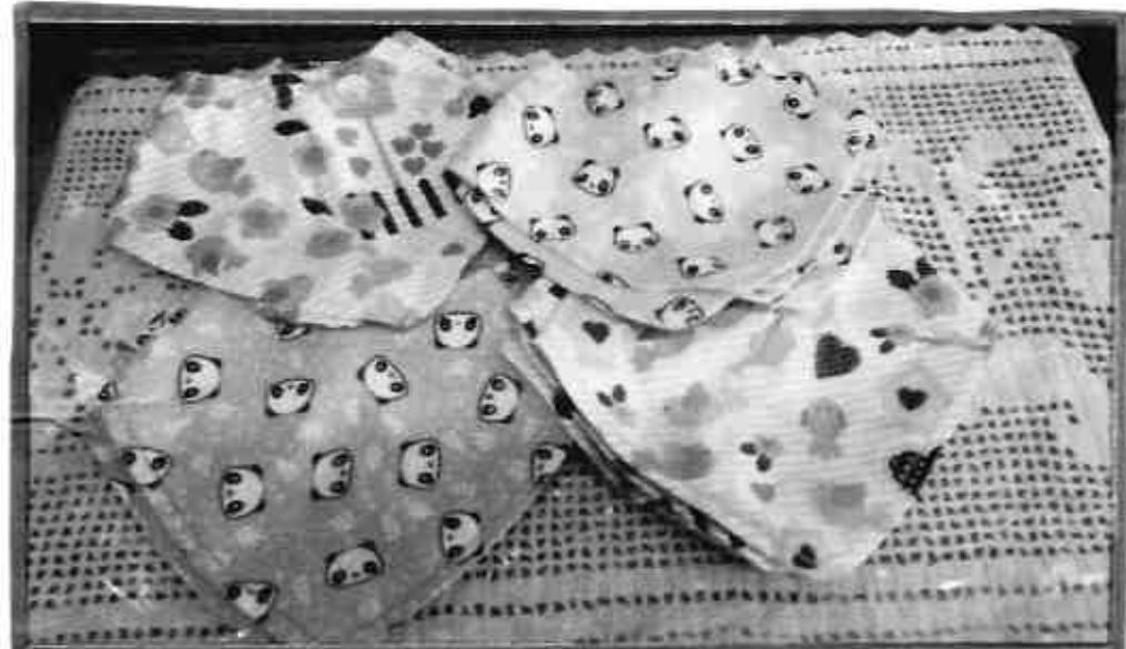
Projeto: Fazer Para Deus (2ª Edição) Técnica: Patchwork Confecção de bandanas para bebês (Kit Maternidade)